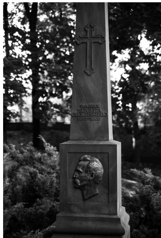
Obelisk upamiętniający Hipolita Cegielskiego na Cmentarzu Zasłużonych Wielkopolan.