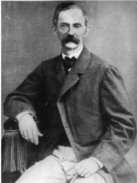
Hipolit Cegielski, kopia ze zbiorów Muzeum Historii Miasta Poznania