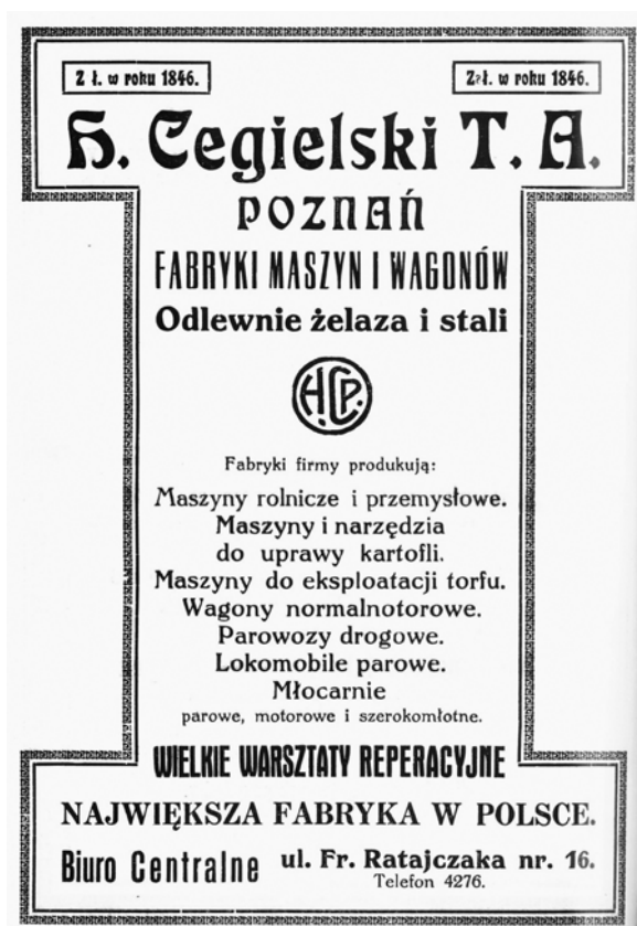
Reklama zakładów H. Cegielski w Poznaniu