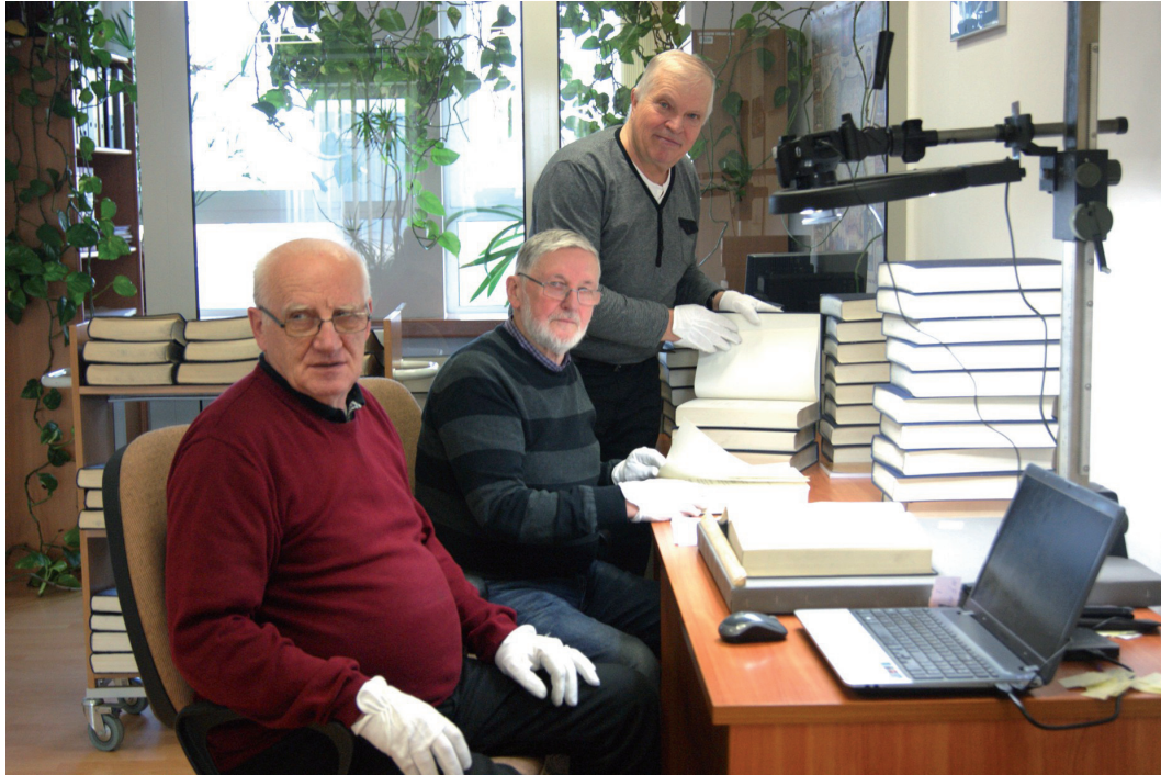
Fot. 1. Podczas pracy w archiwum prezydenta RP, Warszawa, maj 2014 r.